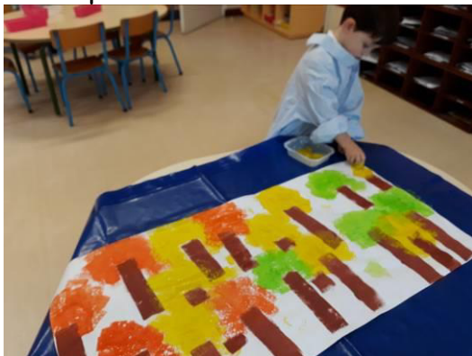
peint la forêt des ours